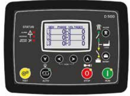
D-500LITE MK2 Kontrol Paneli